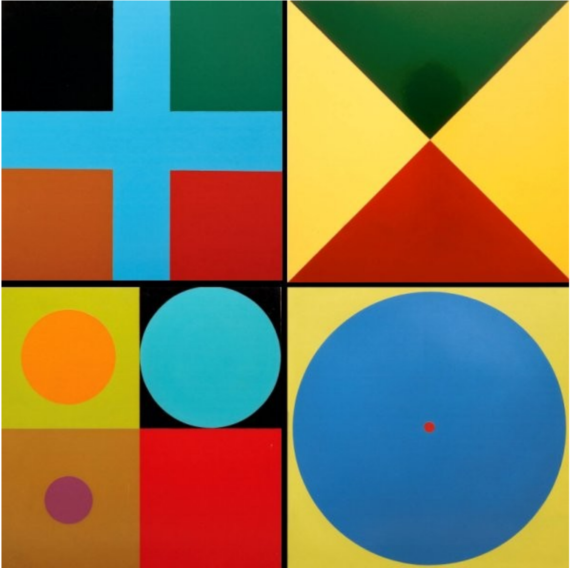
Œuvre de Poul Gernes