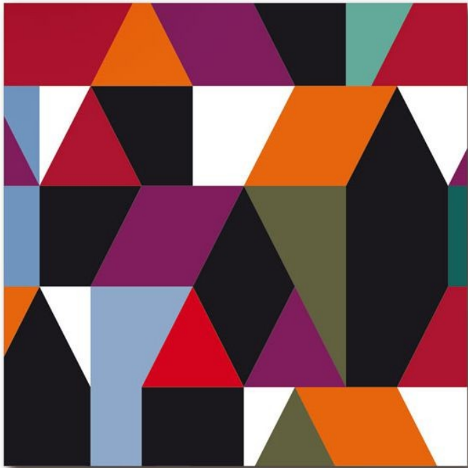
Décoration murale