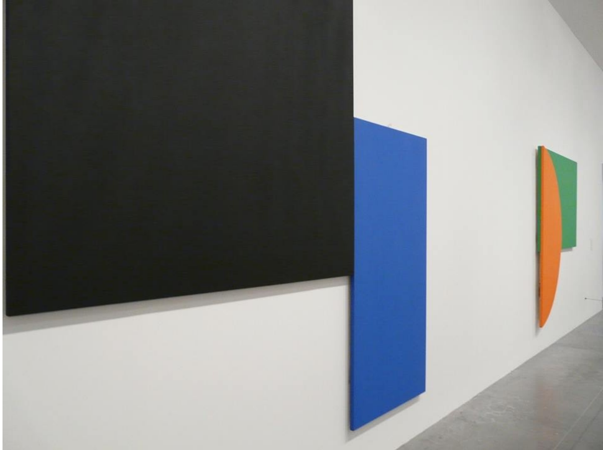
Art contemporain : Tate Modern – Londres