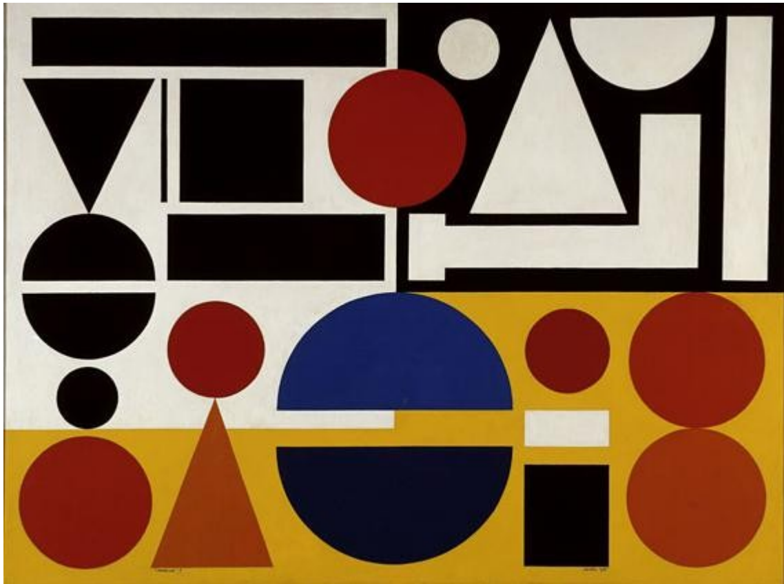
Auguste Herbin – Vendredi 1